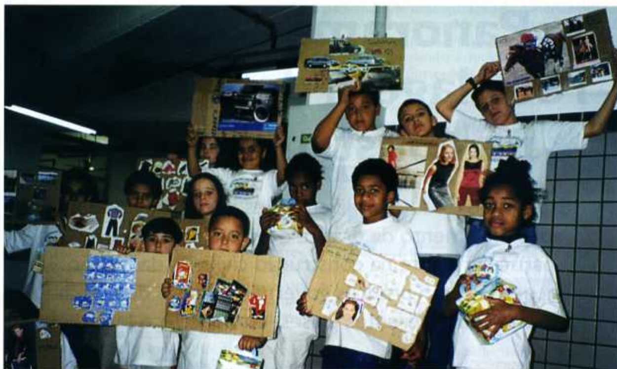
Foto: No Programa "Brincando de Aprender", filhos de funcionários visitam o Condomínio

além de cursos de aculturação, alfabetização e telecurso, ainda em andamento.